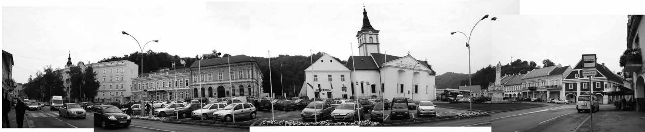
TRG SVETOG TROJSTVA, POŽEGA; FOTO: SILVIJA PRANJIĆ; PROBLEMATIKA PARKIRALIŠTA NA GLAVNOM POŽEŠKOM TRGU NAKRATKO NESTAJE PRILIKOM PRIVREMENIH MANIFESTACIJA

poput jasnih smjerova kretanja pješaka, dovoljne širine putova, dovoljnog broja sanitarija, pristupa interventnih i dostavnih vozila. Više pažnje daje se ukrašavanju prostora, stvaranju spektakla. Naravno, potrebno je stvoriti kvalitetan ugodaj, no nikako ignorirati osnovne zahtjeve prostora prilikom okupljanja većeg broja ljudi. Uz nužnost ostvarenja osnovnih funkcionalnih zahtjeva, privremenost i dalje pruža veliku slobodu istraživanja, stoga čudi česta uniformnost sadržaja, estetika i ideja, kopiranje već viđenog bez adekvatnog promišljanja o raznovrsnim karakteristikama pojedinog