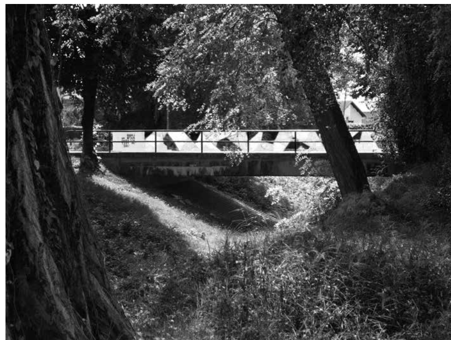
LABORATORIJ ARHITEKTURE: MOSTOVI NA TRNAVI, ČAKOVEC

fiju: izgrađene i neizgrađene strukture koje ga omeđuju i koje postaju dio njega. Slika berlinskog Love Paradea nezamisliva je bez nepregledne mase ljudi okupljene oko Stupa pobjede, okružene zelenim nakupinama Tiergartena: