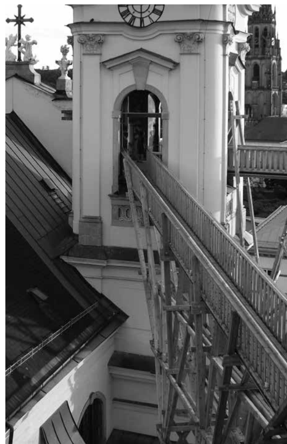
ATELIER BOW-WOW: PROJEKT HÖHENRAUSCH, LINZ, 2011.

Gledajući kroz povijest, naši su javni prostori, trgovi, ulice, parkovi većinu vremena služili svojoj primarnoj svrsi susreta ljudi, a sajmovi, svetkovine ili slični događaji privremeno bi mijenjali njihovo korištenje. U trenutku kad privremeni sadržaj postaje stalan, potrebno je propitati njegovu lokaciju te ako ona nije primjerena, tražiti adekvatno rješenje. Primjer takve dobre prakse jest izmještanje zagrebačkog sajmišta početkom 20. stoljeća iz centra u novo-planirani prostor sajmišta na današnjoj Heinzelovoj ulici te izmještanje zelenog placu na novoizgrađeni Dolac. Na taj je način glavni zagrebački trg ostao multifunkcionalan i prazan, otvoren svim svojim građanima, otvoren za nove privremene sadržaje.